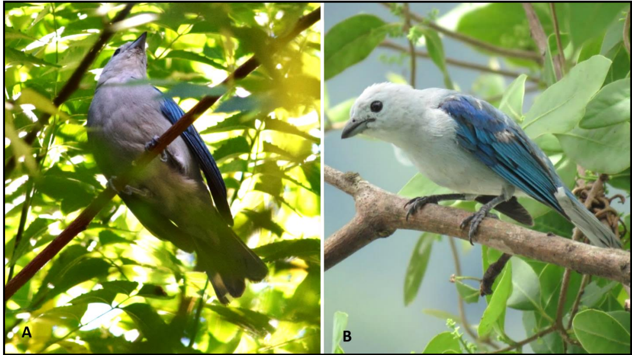
Figura 2. Tangara Azulgris ( Thraupis episcopus ); (A) perchada en un árbol de neem ( Azadirachta indica ) en el Jardín central de Pinotepa Nacional, Oaxaca; (B) en un árbol de guayabo ( Psidium guajava ) en El Paraíso, Guerrero.