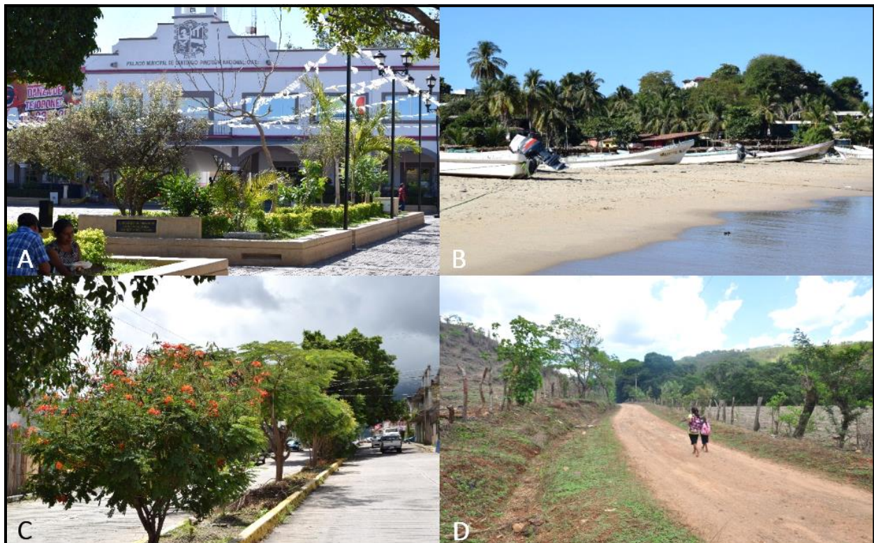
Figura 1. Vegetaciones simplificadas en cuatro localidades donde se ha registrado la Tangara Azulgris; A. Pinotepa Nacional, Oaxaca; B. Punta Maldonado, Guerrero; C. Chilpancingo; D. San Luis Acatlán, en Gro.

( Ficus benjamina ) y tulipán africano ( Spathodea campanulata ) en la periferia y centro de la ciudad de Chilpancingo, Guerrero (17.555206, -99.523696; 1 432 msnm). Recientemente, el día 7 de mayo de 2023, se documentó un registro en Buena Vista de la Salud, municipio de Chilpancingo. La mayoría de los registros se hicieron entre agosto de 2018 y noviembre de 2021. Las localidades donde se obtuvieron los registros, pertenecen a tres provincias bióticas: Planicie Costera del Pacífico, Cuenca del Balsas y Sierra Madre del Sur (Arriaga et al. , 1997). Los registros se documentaron en localidades que presentan vegetación simplificada (Fig. 2), derivada de bosque tropical caducifolio y bosque tropical subcaducifolio o subperennifolio.