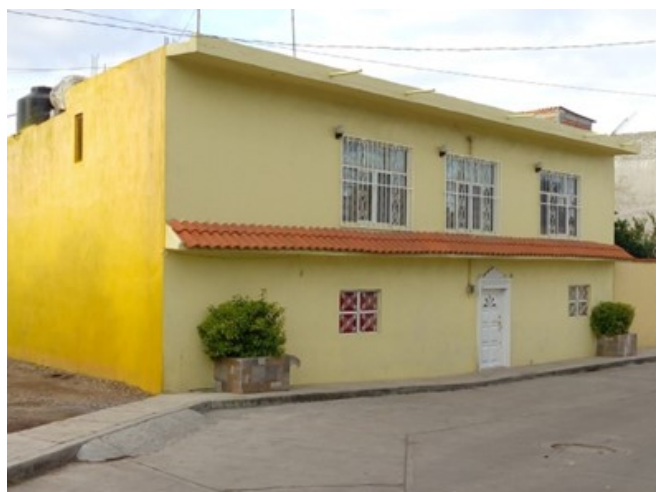
Figuras 4 y 5. Viviendas que presentan cambios formales e incorporación de materiales contemporáneos.