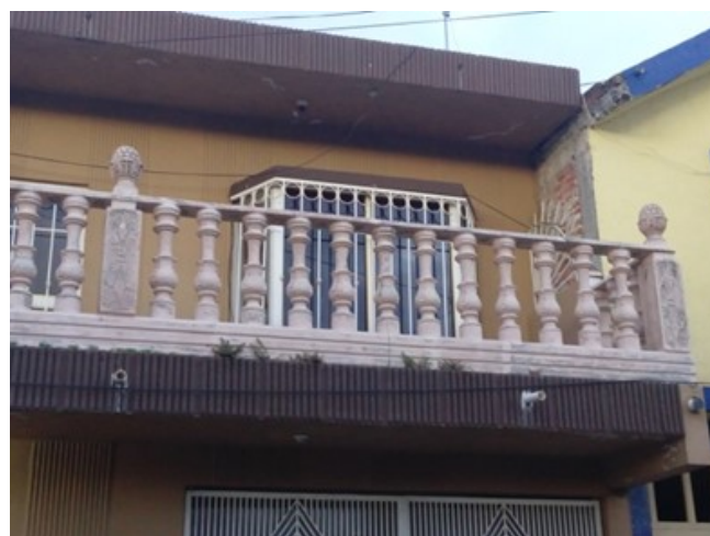
Figuras 8 y 9. Viviendas que presentan cambios formales a través de la ornamentación en fachada.