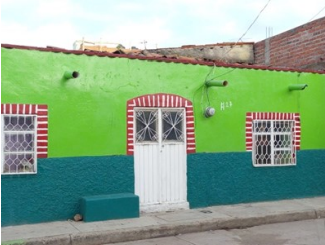
Figura 3. Fachada característica de la vivienda tradicional en Huanimaro, Guanajuato.

contextos geográficos donde el uso de materiales como el ladrillo y el concreto contribuyen a homogeneizar el entorno edificado.