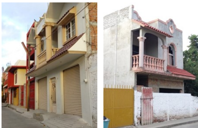
Figuras 10 y 11. Tipologías características de Viviendas nuevas.