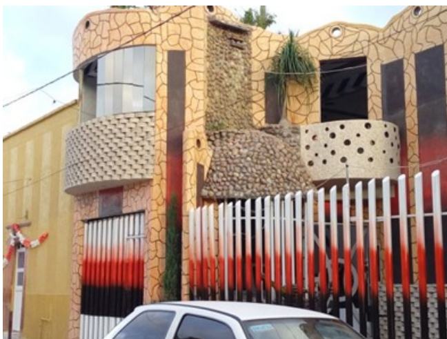
Figura 15. Ruptura de la imagen tradicional de la ciudad por viviendas fuera de contexto.

El análisis descriptivo realizado permite afirmar que las transformaciones de la vivienda tradicional en Huamantla, se da principalmente por el envío de las remesas de los emigrantes quienes invierten en la consolidación de su