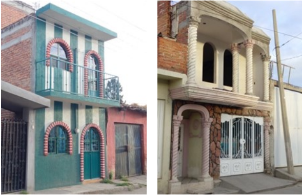
Figuras 13 y 14. Transformaciones de orden estético acorde a los imaginarios propios de los habitantes.

verticalidad (viviendas de dos niveles) el uso de materiales constructivos (adobe por block de concreto o tabique) cubiertas de tejas (por techos planos) e incorporación de estilos arquitectónicos con influencias estadounidenses (principalmente el estilo californiano)