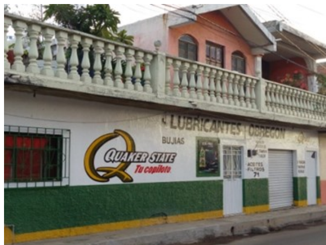
Figuras 6 y 7. Viviendas que presentan cambios funcionales y espaciales.

indica que el 41.2 por ciento pertenecen al sector rural, el 37.5 por ciento al urbano y un 21.4 por ciento corresponden a una localidad mixta.