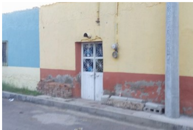
Figuras 1 y 2. Tipología urbano-arquitectónica característica de la vivienda tradicional.