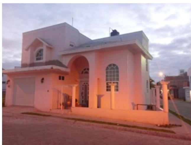
Figura 12. Tipología característica de Viviendas nuevas en el municipio de Huanímaro.

Edificación de nuevas viviendas en distintos contextos (véase Figura 12), modifican la lotificación tradicional (terrenos más angostos), configuración horizontal por la