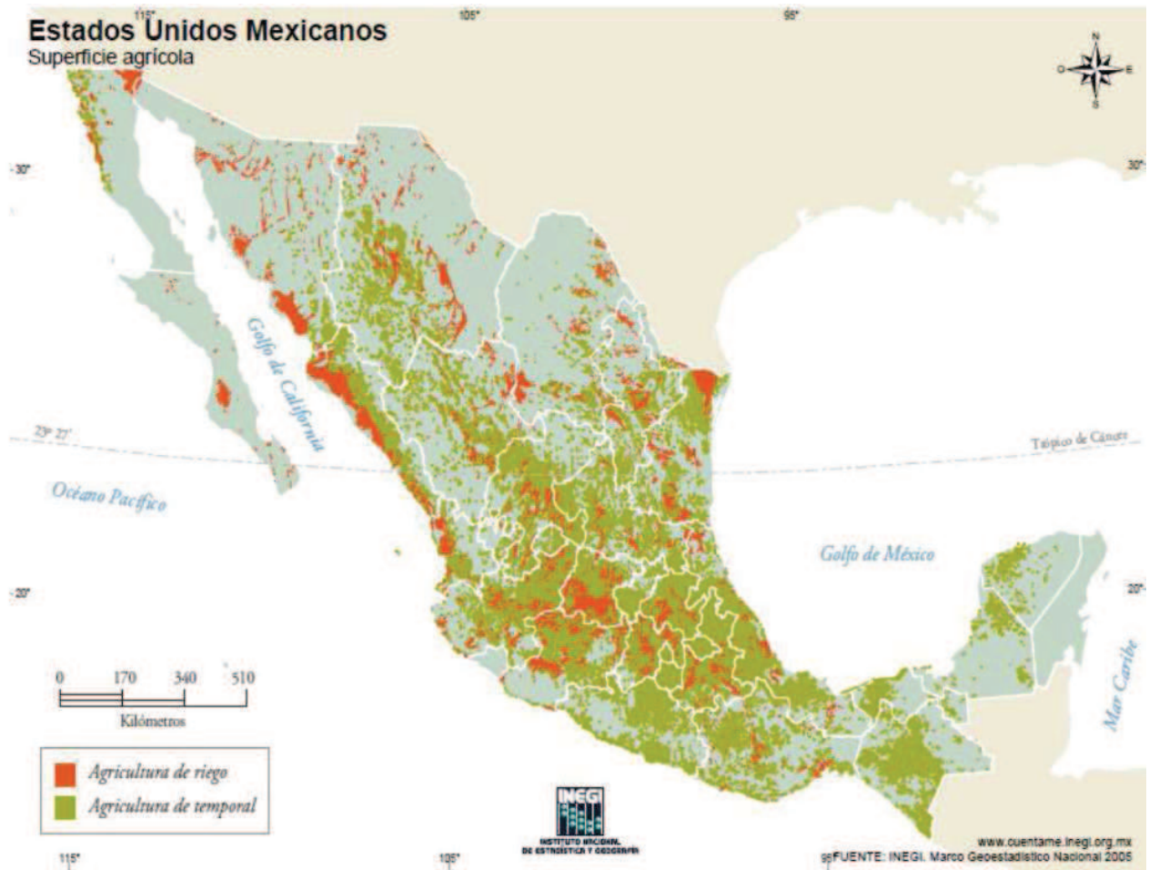
Figura 1. Superficie agrícola de México.

que pueden moderar el daño, o aprovechar sus aspectos beneficiosos (Programas Estatales de Acción ante el Cambio Climático [PEACC], 2014).