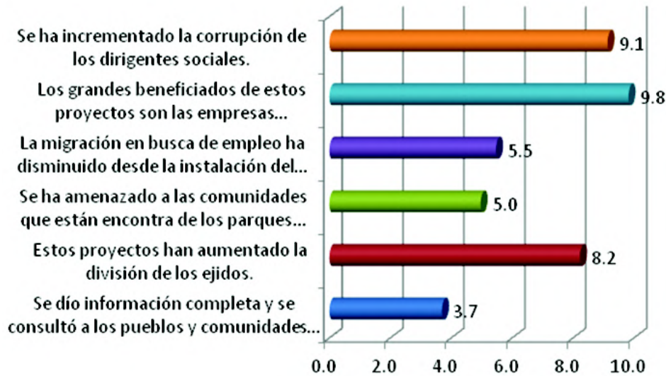
Gráfica 2. Índice de acuerdo sobre el impacto social

do producido por las aspas es muy fuerte; una proporción similar está completamente en desacuerdo con esta afirmación (28% de los entrevistados). Considerando el índice de acuerdo sobre esta afirmación, se obtiene un valor de 5.3, lo cual es evidencia que la mayoría de la población está en desacuerdo con la afirmación que las aspas de los aerogeneradores hacen mucho ruido (véase tabla 1).