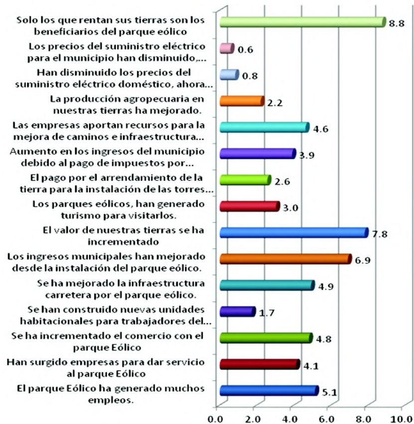
Gráfica 3. Índice de acuerdo sobre impacto económico por la instalación de los parques eólicos

aproximadamente 6% no tiene opinión. El índice de acuerdo sobre esta afirmación es de 7.5 puntos, lo que indica que los ejidatarios están de acuerdo que son frecuentes los derrames de aceite sintético, solventes y pinturas que se utilizan en el mantenimiento de los aerogeneradores (véase gráfica 1).